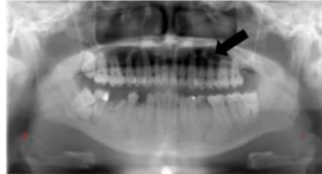
Gambar 3. Kesalahan posisi lidah pasien tidak berada pada palatum

tampak garis hitam yang lebih radiolusen dari gigi rahang atas pada radiograf. Hal ini dapat mempengaruhi interpretasi dari akar dan struktur disekitarnya yang digunakan untuk keperluan diagnostik. Kemungkinan penyebab dari kesalahan ini yaitu kurangnya komunikasi antara operator dan pasien. 6 Radiografer mungkin menemukan kesulitan dalam menginstruksikan pasien untuk menelan dan menjaga agar posisi lidah tetap berada pada langit-langit mulut.