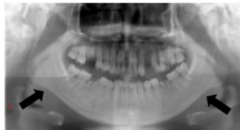
Gambar 4. Kesalahan posisi pasien menempatkan dagu terlalu rendah

Kesalahan posisi yang juga sering terjadi dalam mempengaruhi hasil radiograf yaitu penempatan dagu pasien menempatkan yang terlalu rendah yaitu sebesar 21%. Hal ini memiliki kesamaan dengan penelitian yang telah dilakukan sebelumnya, sebesar 24,4% kegagalan akibat kesalahan posisi dagu. 4 Gambaran yang tampak pada kesalahan posisi ini yaitu apeks dari gigi insisif bawah yang tidak fokus dan kabur; bayangan tulang hyoid tampak ditumpangkan pada mandibula anterior; kondilus tampak terpotong di bagian atas radiograf; tampak gambaran premolar yang tumpang tindih. 7 Kegagalan ini dapat terjadi karena penempatan dagu yang lebih rendah dari reference line . 5 Kesalahan posisi ini dapat dilakukan pencegahan dengan mengikuti instruksi dari produsen mesin, dan bagaimana memposisikan titik anatomis pada wajah dengan reference line pada unit.