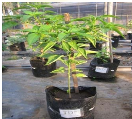
Gambar 1. Morfologi tanaman cabai rawit

Bunga cabai rawit terletak di ujung atau nampak di ketiak, dengan tangkai tegak ( Steenis et al. , 2002). Hal ini juga didukung oleh pernyataan Tjandra (2011), yang mengatakan bahwa bunga cabai rawit keluar dari ketiak daun. Warnanya putih atau putih kehijauan, ada juga yang berwarna ungu. Mahkota bunga berjumlah 4-7 helai dan berbentuk bintang. Bunga dapat berupa bunga tunggal atau 2-3 letaknya berdekatan. Bunga cabai rawit ini bersifat hermaphrodit (berkelamin ganda). Buah buni bulat telur memanjang, buah warnanya merah, rasanya sangat pedas, dengan ujung yang mengguk 1,5-2,5 cm. Buah cabai rawit tumbuh tegak mengarah ke atas. Buah yang masih muda berwarna putih kehijauan atau hijau tua. Ketika sudah tua menjadi hijau kekuningan, jingga, atau merah menyala (Gambar 1).