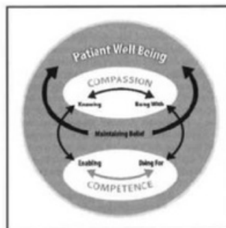
Gambar 3.2 Teori Caring Swanson : Framing the Culture of Carolina Care (Tonges & Ray, 2011)

Swanson mengidentifikasi 3 tipe kondisi penyebab Caring , yaitu klien, perawat dan organisasi. Kondisi organisasi meliputi beberapa komponen dari Profesional Practice Model (PPM) yaitu : (1) kepemimpinan, (2) kompensasi dan penghargaan, serta (3) Hubungan profesional. Apabila 3 komponen ini diciptakan dalam lingkungan kerja akan mendukung praktek Caring dalam pelayanan. (Tonges & Ray, 2011)