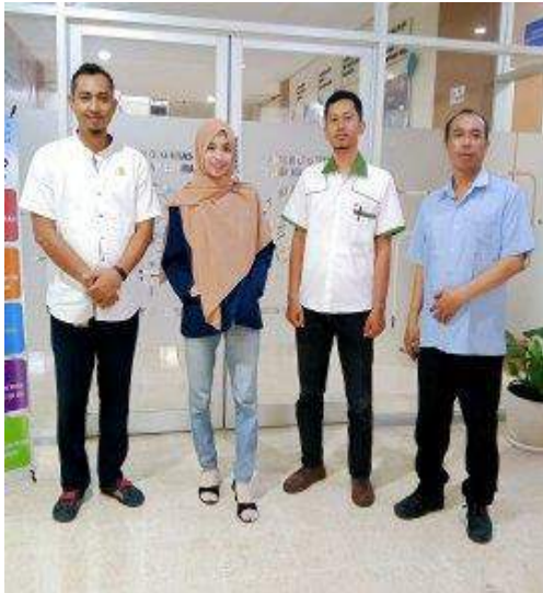
Wawancara dengan Pengguna Jasa