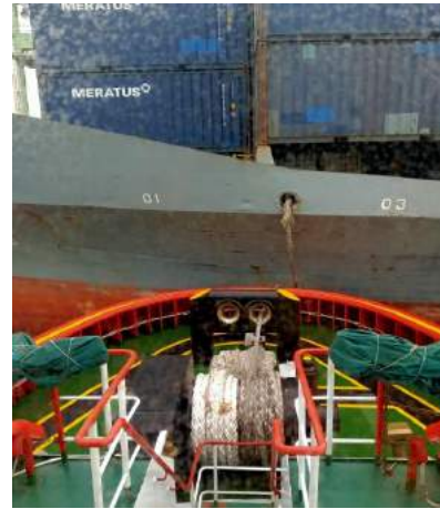
Proses Penundaan Kapal di Pelabuhan Tanjung Perak