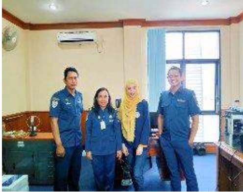
Wawancara di Vessel Traffic Service