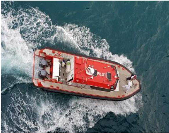
Kapal Pandu di Pelabuhan Tanjung Perak