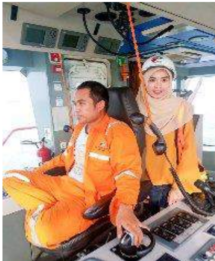
Observasi Lapangan Proses Penundaan Kapal di Pelabuhan Tanjung Perak