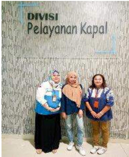
Wawancara dengan Divisi Pelayanan Kapal PT Pelindo III Regional Jawa Timur