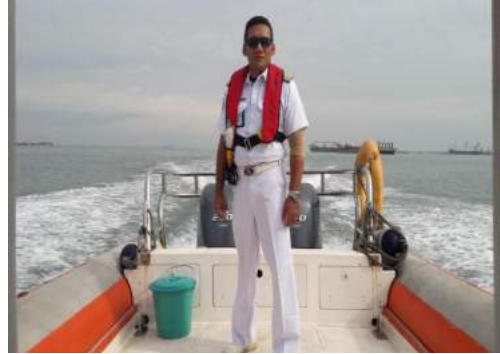
Personel Pandu di Pelabuhan Tanjung Perak