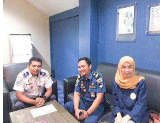
Wawancara dengan Otoritas Pelabuhan Utama Tanjung Perak