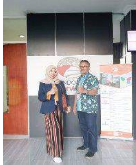
Wawancara dengan Manager Operasi Regional I PT PMS