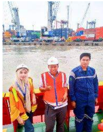
Observasi Lapangan Proses Penundaan Kapal di Pelabuhan Tanjung Perak