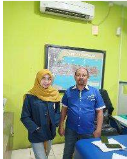
Wawancara dengan Manager on Duty PT Berlian Jasa Terminal Indonesia