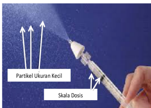
Gambar 2. Mucosal atomizer device (MAD) 22

Gunawan dkk meneliti perbandingan midazolam preparat IV yang diberikan secara intranasal melalui mucosal atomization device (MAD) dengan diazepam suppositoria pada 64 pasien anak usia 1 bulan hingga 13 tahun di Surabaya, Indonesia. Tujuan pemakaian MAD adalah supaya partikel midazolam bisa terdispersi menjadi partikel kecil yang mudah diserap pembuluh darah mukosa nasal (Gambar 2). Alat ini belum tersedia di Indonesia, namun bisa didapatkan secara online dari internet. Didapatkan hasil midazolam IN memiliki efikasi yang lebih baik dibandingkan diazepam perrektal dengan median waktu henti bangkitan 42 detik pada kelompok IN dan 180 detik pada kelompok diazepam rektal. Tidak ditemukan efek samping berupa hipoksia, hipotensi, muntah, batuk, ataupun reaksi alergi pada subyek yang mendapat midazolam IN. 9