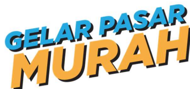
Logo Gelar Pasar Murah