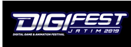
Logo DIGIFEST 2019