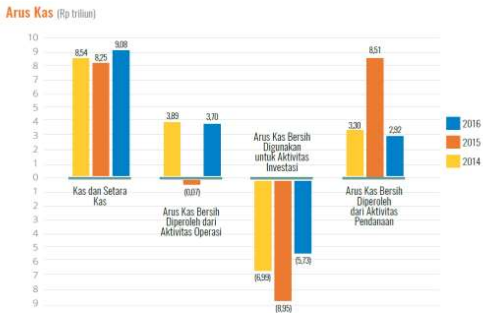
Arus Kas PT Pupuk Indonesia (Persero) Konsolidasian Tahun 2014 – 2016