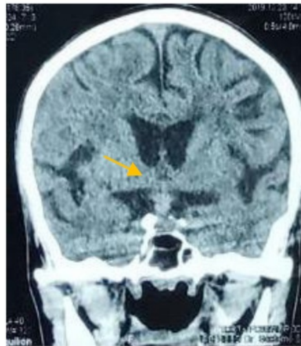
Gambar 1 Hasil Magnetic Resonance Imaging (MRI) Pasien

Keterangan: Hasil MRI pasien menunjukkan adanya lesi ekstra aksial supratentorial di intrasellar yang meluas hingga suprasellar