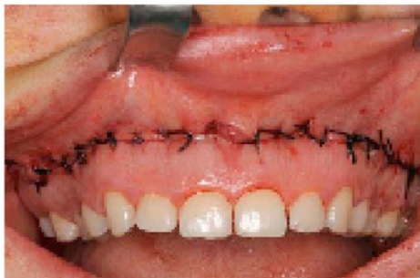
Gambar 3. Kemudian di jahit