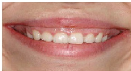
Gambar 1. Sebelum dilakukan lip reposisi

Povidone iodine digunakan sebagai antiseptis ekstraoral. Lokal infiltrasi anastesi dilakukan dari rahang kiri molar pertama sampai molar kanan. Pensil steril digunakan untuk menandai garis perbatasan insisi pada mukosa. Insisi dimulai horisontal pada satu sisi rahang dari frenulum labialis dan diperluas ke molar pertama. Insisi ini sekitar 1mm koronal garis ke mukogingival, insisi kedua dilakukan 10-12mm apikal ke mukogingival dan sejajar dengan insisi pertama. Dua insisi tersebut di hubungkan dengan dua insisi vertikal. Strip dari mukosa serta kekenjar ludah minor dan jaringan lemak dihilangkan. Prosedur yang sama diulangi di sisi lain. Frenulum labial tetap di garis tengah. Semua insisi dilakukan dengan menggunakan scalpel. Kemudian insisi tersebut dijahit dengan benang silk. 18