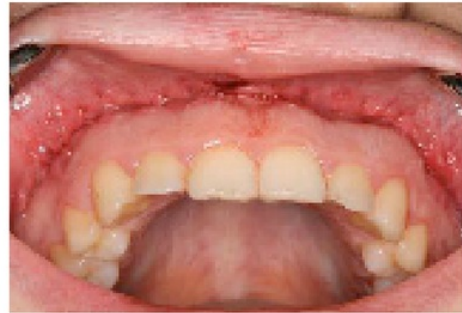
Gambar 4. Setelah dilakukan lip reposisi 1 minggu

Dilakukan lip reposisi dengan pemakaian alat ortodontik