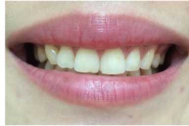
2 bulan pasca operasi