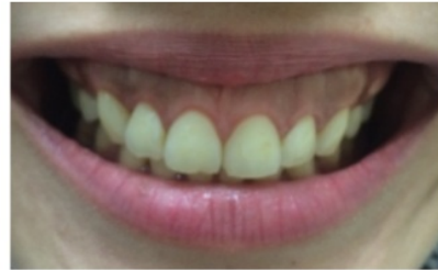
1 bulan pasca gingivektomi