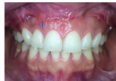
21 hari pasca operasi