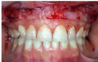
refleksi partial thickness