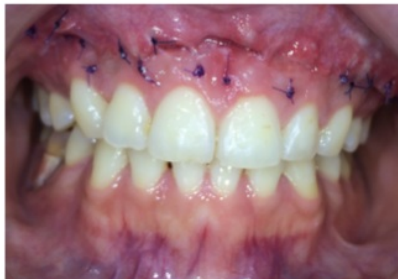
7 hari pasca operasi