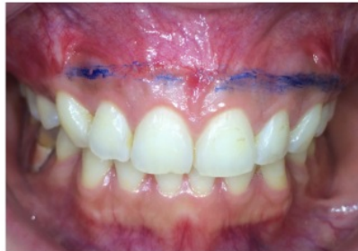
penandaan garis insisi