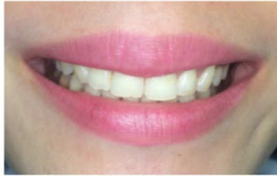
1 bulan pasca operasi