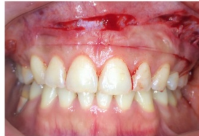
insisi attached gingiva – vestibulum