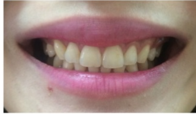
3 bulan pasca operasi