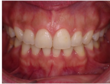
Analisa Intra Oral