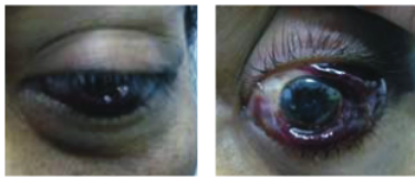
Gambar 1. Keadaan penderita 1 jam setelah datang ke RS dengan perdarahan subkonjungtiva.

Dari pemeriksaan fisik, didapatkan tajam penglihatan kedua mata 6/6, dengan tekanan intraokuler mata kanan 12,2 mmHg dan mata kiri 17,3 mmHg. Segmen anterior mata kanan didapatkan edema palpebra, lain-lain tidak didapatkan kelainan. Segmen anterior mata kiri didapatkan edema dan hematoma palpebra yang minimal, hematoma hanya pada tepi lateral palpebra superior, proptosis, perdarahan subkonjungtiva dan kemosis di daerah superior, temporal dan inferior. Pemeriksaan oftalmoskopi langsung pada kedua mata didapatkan perdarahan flamed shape , dengan tortuosity pembuluh darah yang tampak jelas. Didapatkan hambatan gerakan bola mata pada mata kiri.