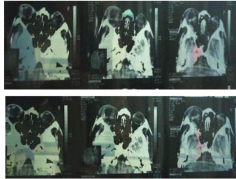
Gambar 2. Tampak proptosis pada mata kiri dan lesi hiperdens pada retrobulber, curiga suatu perdarahan.

Selanjutnya, karena adanya tanda perdarahan yang progresif dan perpanjangan Prothrombin Time, APPT dan INR yang merupakan indikasi terjadinya gangguan