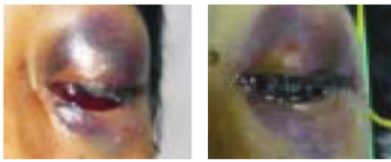
Gambar 4. Tampak proptosis makin berat, foto diambil 1 jam sebelum penderita meninggal

Penatalaksanaan penderita diprioritaskan untuk mengatasi kegawatannya karena keadaan umum yang memburuk dan didapatkan tanda-tanda perdarahan massif dan progresif pada organ vital. Penderita tidak sadar, dilakukan resusitasi oleh sejawat Anestesiologi, namun akhirnya penderita meninggal pada tanggal 15 Februari 2009 pukul 12.45, atau setelah sekitar 22 jam dirawat.