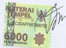
VIDIA DINDA SAKTI