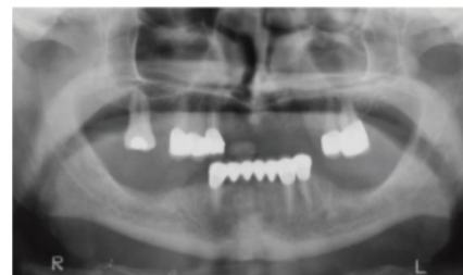
Gambar 1. Kategori C1: Korteks tajam di kedua sisi 13

Penelitian ini merupakan penelitian observasional deskriptif dengan jumlah sampel 18 wanita osteoporosis dan 18 wanita yang tidak menderita osteoporosis dengan kriteria, yaitu wanita post-menopause berusia lebih dari 50 tahun, sudah didiagnosis osteoporosis oleh dokter menggunakan BMD, oral hygiene baik, tidak merokok dan tidak menderita penyakit sistemik lainnya. Subyek dilakukan foto panoramik. Hasil radiografik panoramik diletakkan diatas viewer dan kemudian diamati oleh pengamat. Pengamatan dilakukan dengan melihat gambaran kortikal mandibula dan diklasifikasikan ke dalam tiga kategori MCI.