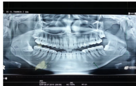
Gambar 1. Pengukuran Besar Sudut Gonial Mandibula

Berdasarkan penelitian yang telah dilakukan, didapatkan hasil besaran nilai rata - rata sudut gonial seperti berikut :