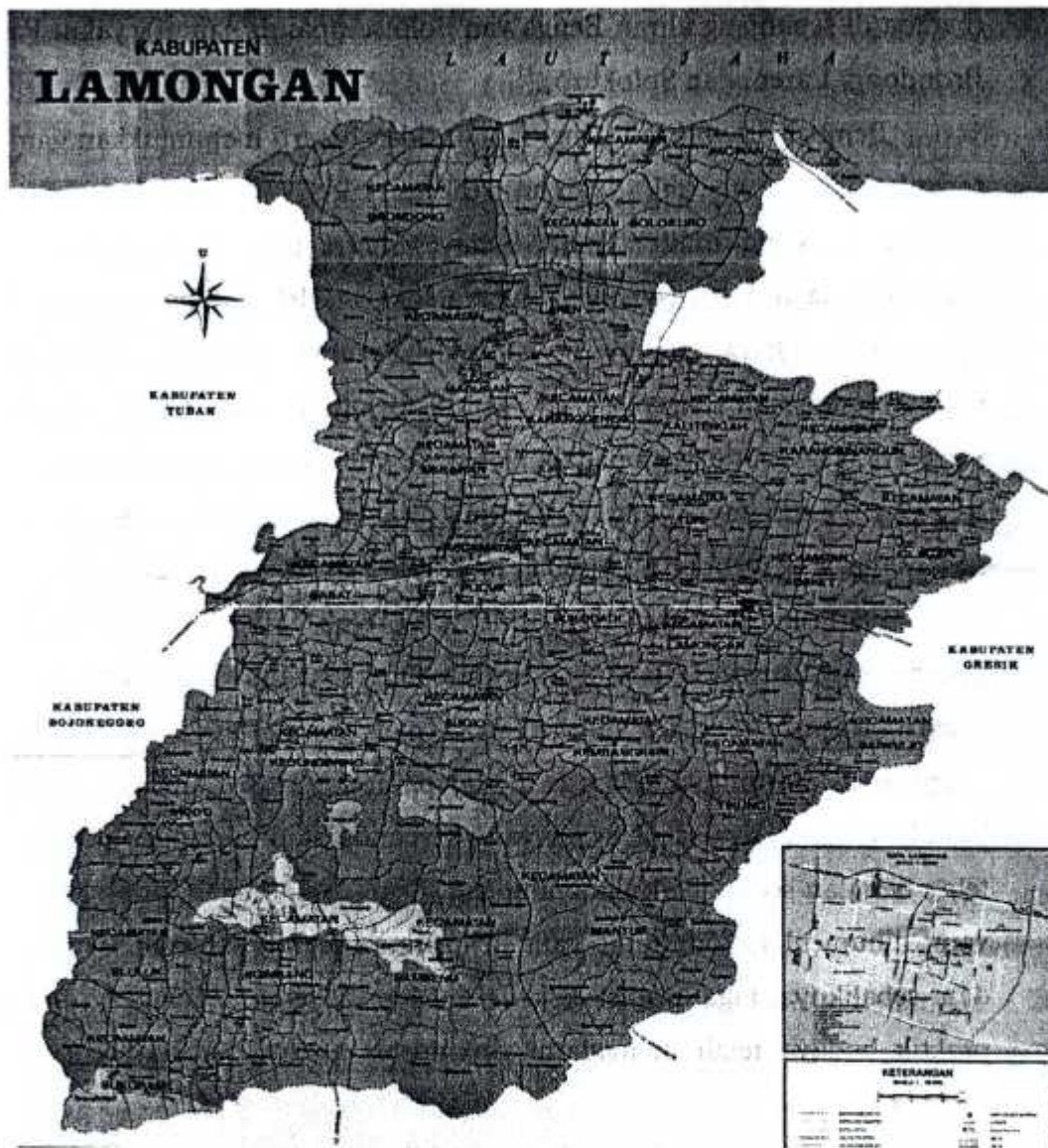
Gambar 1 : Peta Kabupaten Lamongan