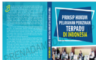
PDF Cover_Prinsip Hu...