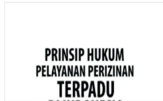
PDF prinsip hukum pel...