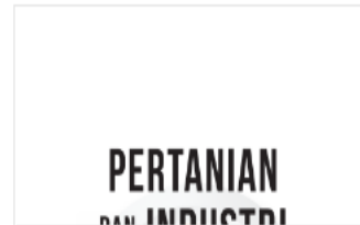
PDF Pertanian & Indus...