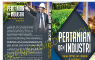
PDF Cover_Pertanian ...