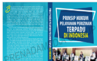
PDF Cover_Prinsip Hu...