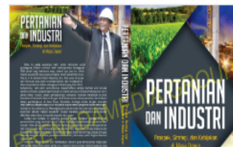
PDF Cover_Pertanian ...