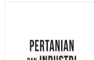
PDF Pertanian & Indus...