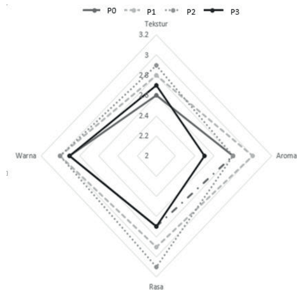
Gambar 2. Grafik Radar Daya Terima Panelis

sama memperoleh nilai mean rank 3,0 (suka) tidak ada perbedaan yang signifikan. Hal ini dikarenakan jumlah penambahan pisang yang tetap pada setiap formulasi, sehingga tidak ada perbedaan reaksi karamelisasi gula fruktosa. Hal ini dibuktikan pada penilaian statistik dengan nilai p-value 0,626 ( \alpha=0,005 ). Nilai p-value lebih besar dari nilai \alpha sehingga tidak ada pengaruh signifikan dalam parameter warna pada snack bar formulasi tinggi kalium tinggi serat untuk olahragawan.