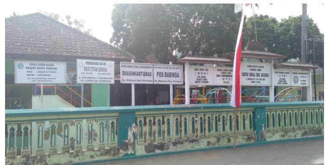
Gambar 1. Tempat pelaksanaan pembuatan sabun.

Pelatihan pembuatan sabun handmade dilaksanakan di Balai Desa Mojosari, Kauman Tulung Agung pada tanggal 28 - 29 Juli 2019 (Gambar 1). Program sosialisasi pengabdian masyarakat dilakukan di Balai desa Mojosari yang dihadiri oleh masyarakat daerah setempat, umumnya kaum wanita. Peserta yang hadir berjumlah 20 orang dan umumnya ibu rumah tangga tidak bermata pencaharian (pengangguran). Kegiatan sosialisasi dilakukan dengan memberikan petunjuk teknis terkait dengan pembuatan sabun. Petunjuk teknis dibuat dengan cara sesederhana mungkin agar mudah dipahami dan dapat diimplementasikan oleh masyarakat dengan tepat (Gambar 2). Kegiatan sosialisasi dilakukan dengan pemaparan materi secara visual menggunakan power point/ slide supaya masyarakat tertarik dan memperoleh gambaran secara jelas tentang proses pembuatan sabun sulfur.