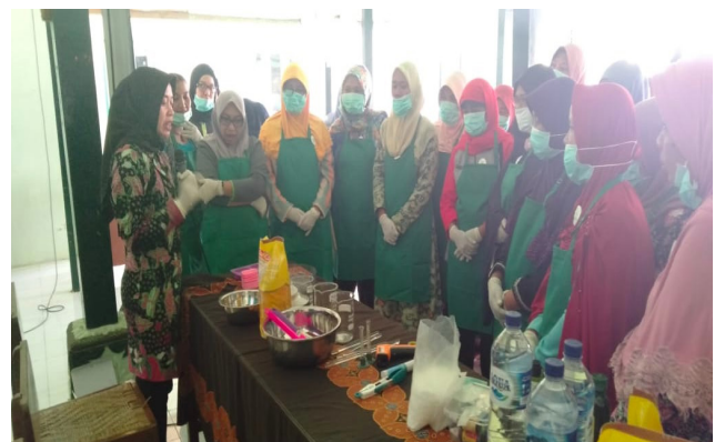
Gambar 2. Pemberian petunjuk teknis tentang pembuatan sabun sulfur ke peserta.