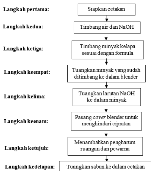
Gambar 3. Bagan cara pembuatan sabun sulfur.

Langkah-langkah pembuatan sabun ditunjukkan dalam bagan Gambar 3. Langkah pertama menyiapkan cetakan, dilanjutkan dengan menimbang air dan NaOH. Kemudian dilakukan penimbangan minyak kelapa sesuai dengan formula, selanjutnya minyak dituang dengan larutan NaOH dengan hati-hati. Langkah selanjutnya adalah memasang penutup blender, dan meletakkan kain di atas penutup tersebut untuk menghindari cipratan. Bagian akhir proses adalah pewarnaan dan pemberian pengharum, selanjutnya masa sabun dicetak pada cetakan yang sudah tersedia (Gambar 4).