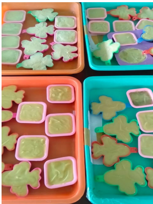
Gambar 4. Hasil pembuatan sabun sulfur.

Setelah proses pembuatan sabun sulfur selesai dilaksanakan, dilanjutkan dengan tahap pelatihan