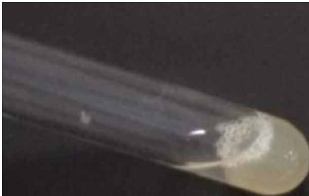
Gambar 4. Uji koagulase positif