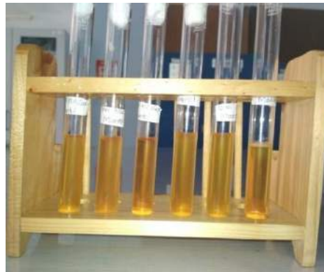
Gambar 3. Uji manitol positif