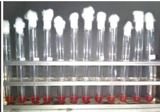
Gambar 5. Uji VP positif

Berdasarkan hasil uji katalase (Gambar 2), 19 isolat bakteri terlihat semua positif bergelembung yang membuktikan bahwa isolate tersebut merupakan Staphylococcus (Purnomo et al. , 2006).