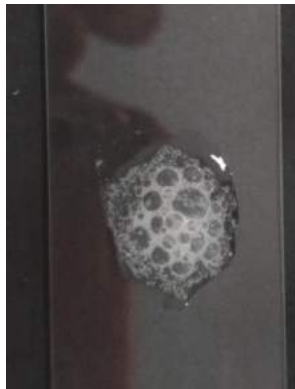
Gambar 2. Uji katalase positif