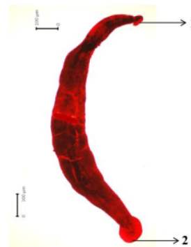
Gambar 1. Zeylanicobdella dengan perbesaran 40x. Keterangan: (1) anterior sucker, (2) posterior sucker

parameter pendukung pada penelitian dengan tujuan mengetahui kondisi lingkungan yang merupakan salah satu faktor stres. Hasil pengukuran kualitas air dapat dilihat pada Tabel 6.