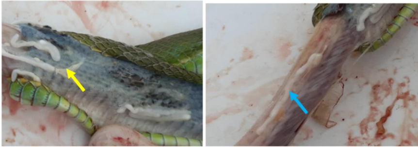
Gambar 1. Acanthocephala yang ditunjuk tanda panah, (→) Subcutan (→) Jaringan otot ular hijau.