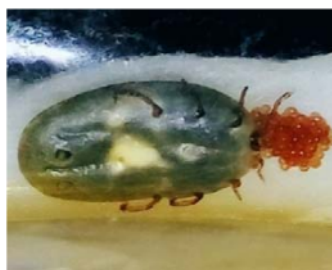
Gambar 1. Caplak B. microplus Betina yang sedang Bertelur.

Larva B. microplus didapat dari caplak dewasa betina fase engorged yang berjumlah 5 ekor dan masing-masing ditempatkan di wadah tabung, kemudian dilakukan proses rearing pada caplak hingga didapatkan telur yang dikeluarkan secara berkala. Telur ditunggu hingga menetas menjadi larva kemudian ditunggu kembali hingga larva berumur tujuh hari. Sebanyak 250 ekor larva berumur tujuh hari diambil secara acak, kemudian dibagi ke dalam lima kelompok dan masing-masing kelompok terdiri dari 10 larva B. microplus . Setiap perlakuan terdiri atas lima pengulangan. Kelompok perlakuan terdiri dari K-, K+, P1, P2, P3.