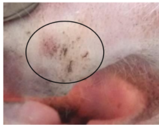
Gambar 2. Garis Zig-zag dari Tinta Cina yang Berpenetrasi ke Dalam Terowongan dari Sampel Kelinci Yang Terinfestasi Skabies dengan Tes Tinta Terowongan Menggunakan Kamera dengan Resolusi 2 Megapixel Perbesaran 4x.