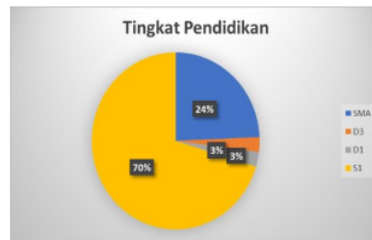
Gambar 1. Tingkat Pendidikan peserta pengmas 2019 di Kec Kertosono, Kab. Nganjuk

Tingkat Pendidikan peserta pengmas ini terbanyak adalah S1 dengan persentase 70%, kemudian SMA 24%, dan D1 serta D3 3%.