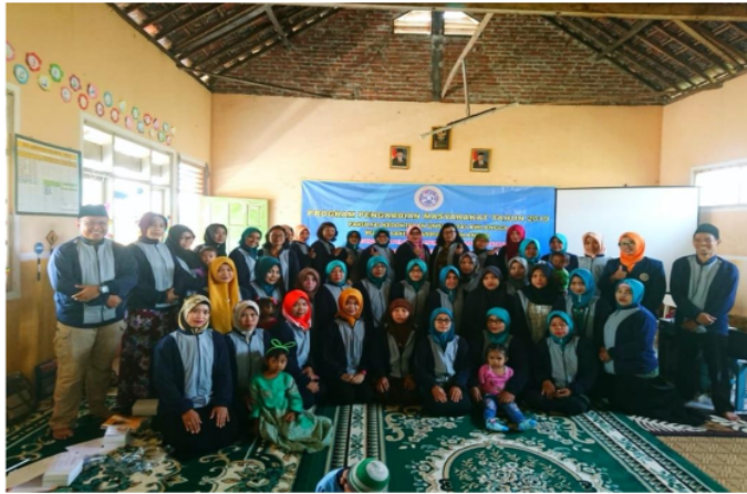
Gambar 4. Kegiatan Pelatihan dan Workshop Parenting Mengatasi Tantrum

Pelatihan dan workshop parenting mengatasi tantrum ini cukup memberikan manfaat kepada para peserta. Para peserta diberikan materi awal tentang teori perkembangan anak, apa penyebab tantrum, perbedaan tantrum normal dan abnormal, cara mengatasi tantrum, serta bagaimana mencegah tantrum agar tidak terjadi baik di sekolah maupun di rumah. Setelah pemaparan tersebut, peningkatan kognitif, afektif dan psikomotor diharapkan dapat meningkat. Hal ini dapat dilihat dari hasil peningkatan nilai pretest dan posttest yang cukup tinggi. Peningkatan terhadap afektif dan psikomotor juga terlihat dari demo terhadap kasus tentang tantrum yang diberikan kepada peserta. Peserta workshop dan pelatihan yang telah memahami masalah tantrum dan teori perkembangan anak diharapkan menjadi educator dalam parenting kepada masyarakat di kecamatan Kertosono, kabupaten Nganjuk.