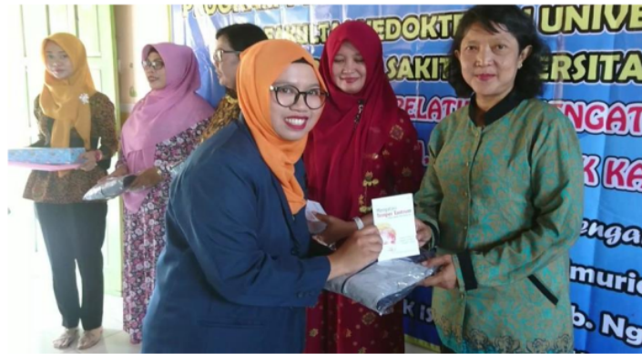
Gambar 3. Penyerahan Buku Pelatihan dan Workshop Parenting Mengatasi Tantrum kepada Peserta

karena para peserta sering mendapatkan kasus tantrum dalam kehidupan sehari-hari. Selain itu tingkat pengetahuan peserta yang kurang juga menjadi motivasi untuk mengikuti pelatihan dan workshop tantrum ini. karakteristik peserta yang rata-rata berusia 38 tahun juga menjadi motivasi untuk mengikuti pelatihan dan workshop ini. Pada usia ini, peserta sering menjumpai kasus tantrum dalam kehidupan sehari-hari. Peserta pada rentang usia 35 tahunan merupakan populasi ibu-ibu dengan anak usia pra sekolah dan latar belakang sebagai guru TK dan KB secara langsung peserta akan berhadapan dengan murid yang sering mengalami tantrum.