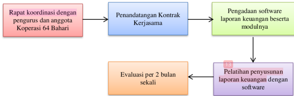
Gambar 2. Tahapan Pelaksanaan Kegiatan.

Terdapat beberapa tahapan pelaksanaan program pengabdian masyarakat ini. Hal ini tampak pada diagram alur berikut: