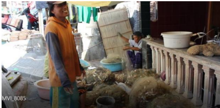
Gambar 6. Aktifitas Nelayan Saat Mengambil Hasil Tangkapan Ikan

Selama ini, para nelayan langsung menjual ikan hasil tangkapan ke tengkulak. Akibatnya, harga yang mereka terima seringkali murah. Sementara itu, permintaan terhadap ikan dengan kualitas baik juga sangat tinggi di masyarakat yang sadar akan kesehatan. Para nelayan berharap bisa sedikit demi sedikit menjual ikan segar ke masyarakat. Namun, mereka masih terkendala dengan belum adanya freezer untuk menyimpan ikan segar agar tidak cepat basi. Beberapa jenis ikan hasil tangkapan nelayan anggota koperasi ini adalah ikan kakap, ikan bulu ayam, ikan keteng, udang, kerang hijau, dan kepiting.