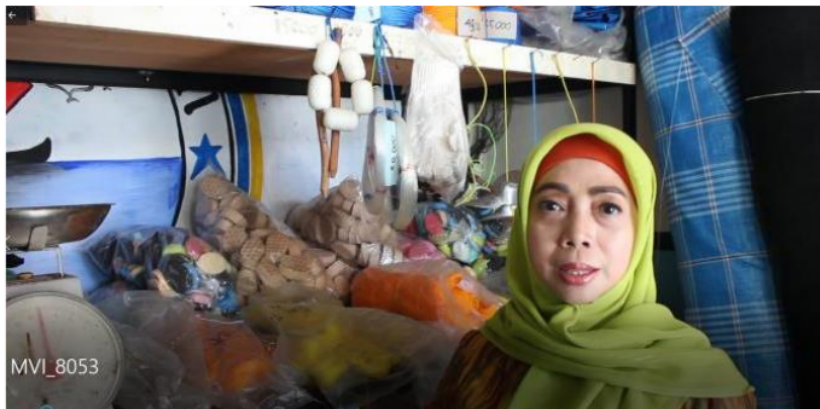
Gambar 5. Potret Barang Dagangan Toserba Koperasi 64 Bahari.

Seluruh anggota Koperasi 64 Bahari adalah nelayan dan istri nelayan. Selama ini, aktifitas Koperasi 64 Bahari difokuskan pada dua kegiatan, yaitu Toserba dan Unit Simpan Pinjam (USP). Unit Toserba dikelola oleh para bapak nelayan sehingga barang yang dijual merupakan semua kebutuhan untuk menangkap ikan. Sementara itu, unit USP dikelola oleh para istri nelayan dengan memberikan jasa simpan pinjam kepada anggota.