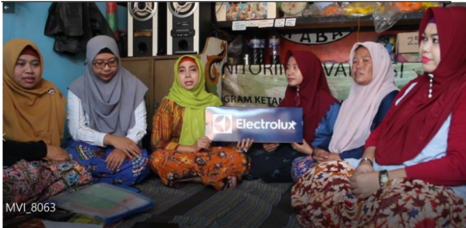
Gambar 7. Penyerahan Simbolik Bantuan Freezer.

Pembelian freezer dilakukan sendiri oleh ketua Koperasi 64 Bahari Surabaya di Toko Elektronik Hartono. Pada waktu kedatangan tim pengabdian masyarakat Universitas Airlangga, freezer belum sampai lokasi sehingga dilakukan penyerahan secara simbolik kepada istri nelayan yang tergabung di unit simpan pinjam. Namun demikian, ketika tim pelaksana bergegas mengakhiri kegiatan, tiba-tiba petugas dari Hartono datang sehingga bisa dilakukan penyerahan freezer secara langsung.