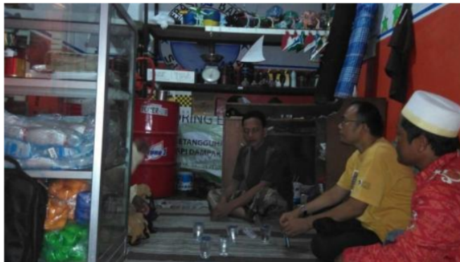
Gambar 1. Aktivitas Nelayan di Koperasi 64 Bahari.

Oleh karena itu, pada Januari 2017 Kelompok Nelayan Nambangan dan Cumpat, Kelurahan Kedung Cowek, Kecamatan Kenjeran, Surabaya mendirikan Koperasi 64 Bahari. Koperasi ini diinisiasi oleh kelompok nelayan yang tergabung di Kesatuan Nelayan Tradisional Indonesia (KNTI) di Nambangan dan Cumpat dengan dibantu oleh Lembaga Swadaya Masyarakat (LSM) Wahana Lingkungan Hidup Indonesia (WALHI) Jawa Timur. Pada 2018, koperasi ini mendapatkan pendampingan dari Tim Pengabdian Masyarakat Departemen Ilmu Ekonomi Universitas Airlangga mengenai pengurusan badan hukum koperasi dan pemanfaatan dana wakaf untuk modal nelayan.