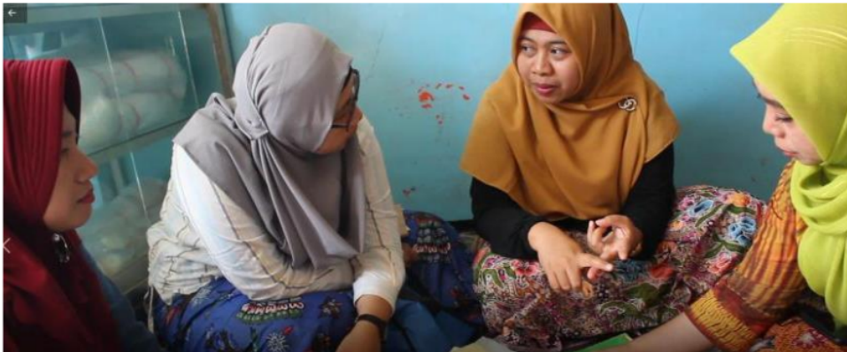
Gambar 4. Pelatihan Penyusunan Laporan Keuangan Kepada Pengelola Koperasi 64 Bahari, Kenjeran.

Kegiatan pelatihan penyusunan laporan keuangan kepada pengurus koperasi 64 Bahari dilaksanakan pada hari Sabtu, 8 Juni 2019. Setelah melihat situasi dimana koperasi tersebut memiliki permasalahan mengenai cara menyusun laporan keuangan dan kurangnya pengetahuan mengenai cara menggunakan aplikasi keuangan. Pada tahun ini pendampingan dilakukan terutama mengenai aspek pencatatan keuangan. Dimana jumlah asset koperasi 64 Bahari yang semakin besar dan para pengurus koperasi 64 Bahari harus bisa menyusun laporan keuangan dengan baik.