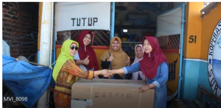
Gambar 8. Penyerahan Bantuan Freezer Secara Langsung.

Pembelian freezer dilakukan sendiri oleh ketua Koperasi 64 Bahari Surabaya di Toko Elektronik Hartono. Pada waktu kedatangan tim pengabdian masyarakat Universitas Airlangga, freezer belum sampai lokasi sehingga dilakukan penyerahan secara simbolik kepada istri nelayan yang tergabung di unit simpan pinjam. Namun demikian, ketika tim pelaksana bergegas mengakhiri kegiatan, tiba-tiba petugas dari Hartono datang sehingga bisa dilakukan penyerahan freezer secara langsung.