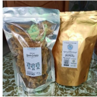
Gambar 3. Produk Hasil Repackaging