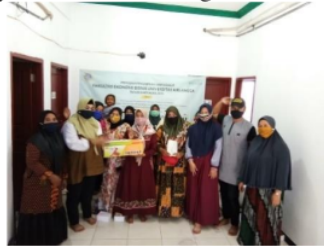
Gambar 2 Penyerahan Mesin Vacuum Sealer

yaitu fungsi untuk menyedot oksigen dari dalam kantong kemasan dan sekaligus fungsi untuk menyegel kantong kemasan itu sendiri (Agusti and Wasisto 2019). Mesin ini sangat bermanfaat untuk membantu para istri nelayan mengaplikasikan materi di pelatihan ke dalam produk-produknya. Sehingga dapat meningkatkan nilai jual produk dan pendapatan keluarga nelayan semakin meningkat