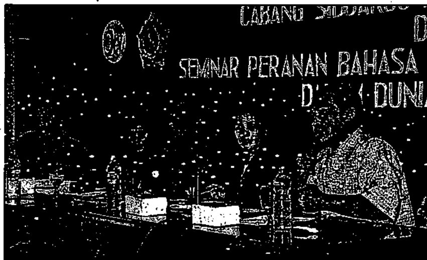
PRO-KONTRA: Pembicara yang tampil dalam seminar di Delta Graha Sidoarjo kemarin.

Kendati sudah beberapa kali acara serupa dihelat, masih saja pro kontra mewarnai. "Kalau dihubungkan dengan masalah pendidikan, bahasanya Pojok Kampung itu banyak yang nggak mendidik," ujar Siti, salah seorang peserta. Dia khawatir acara yang ditayangkan pukul