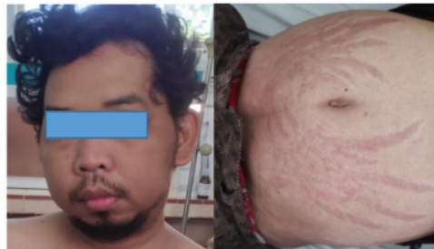
Gambar 1. Tampilan klinis pasien moon face (kiri) and abdominal striae (kanan)

Berdasarkan data tersebut, diagnosis kerja awal pasien adalah SCE, pneumonia komunitas, anemia (8,9 g/dL), dan hipoalbuminemia (2,3 mg/dL). Berdasarkan diagnosis kerja tersebut, rencana awal yang dilakukan adalah melakukan evaluasi aksis hipotalamus-pituitari (HPA) dengan pemeriksaan lanjutan dan melakukan tata laksana pneumonia komunitas dengan seftriakson 1 gram tiap 12 jam intravena drip. Pemeriksaan laboratorium serum kortisol pagi pasien ini 8,23 \mu g/dL (normal 4,30-22,40 \mu g/dL) dengan sedikit peningkatan adrenocorticotrophic hormone (ACTH) serum 54,2 pg/mL (normal <46 pg/mL). Dilakukan tes overnight low-dose dexamethasone suppression yang menunjukkan hasil positif dengan kadar kortisol serum pagi hari 2,19 \mu g/dL. Pada pemeriksaan radiologi didapatkan osteofit bilateral yang konsisten dengan osteoarthritis derajat II menurut klasifikasi Kellgen-Lawrence. 13 Kultur sputum menunjukkan