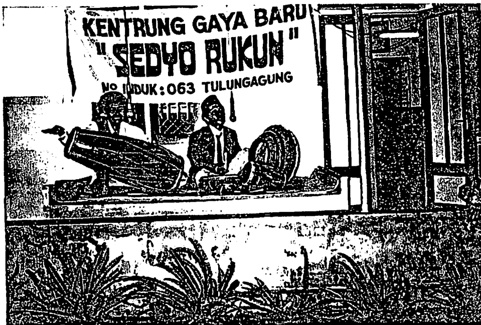
Gambar 3: Petunjukan kentrung Sedya Rukun.