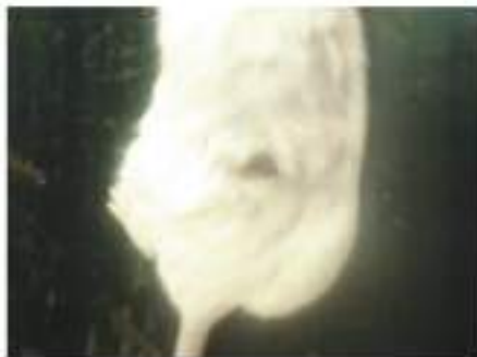
(c) kelompok perlakuan hari ke-4