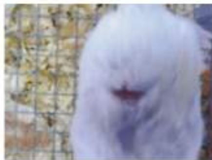
(b) kelompok kontrol hari ke-7