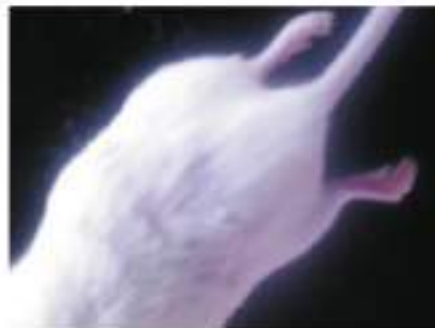
(d) kelompok perlakuan hari ke-7

Gambar 1. Foto luka insisi pada punggung mencit kelompok kontrol dan perlakuan hari ke-4 (K4, P4) dan kelompok kontrol dan perlakuan pada hari ke-7 (K7, P7).