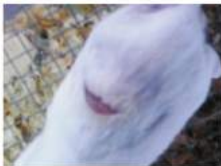
(a) Kelompok kontrol hari ke-4

Data berupa penyempitan area insisi karena proses epitelisasi dan jumlah fibroblast pada pengamatan preparat histopatologi pada hari ke-4 dan ke-7 ditabulasikan dan kemudian dianalisis secara statistik. Data dianalisis menggunakan program SPSS 21 dengan uji one way analysis of variance (ANOVA) dilanjutkan dengan uji least significance difference (LSD) .