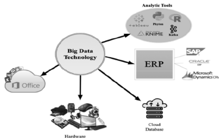
Gambar 1 Connectivity Capabilities

Processing Unit (CPU) apakah menggunakan Intel (WindowsOS) ataukah menggunakan power PC (MacOS). Agar teknologi informasi dapat kompatibel dengan sistem lain adalah dengan menggunakan operating systems yang sama, sebab hal ini akan memudahkan perusahaan dalam mengintegrasikan infrastrukturnya termasuk melakukan relasional databasenya. Dengan menggunakan sistem operasi yang sama, secara ekonomis juga akan meminimalkan biaya pelatihan kepada pengguna sistem, karena mereka sudah terbiasa dengan sistem yang sudah ada saat ini. Dengan sistem operasi yang sama, antar pengguna juga dapat berbagi pakai data seperti spreadsheets , word processing , file data, dan email. Agar sistem selalu uptodate dan mengikuti perkembangan, sistem harus di update secara berkala, rata-rata update sistem adalah setiap 2 hingga 3 tahun, proses ini akan mengatasi masalah adanya bug dari program lama dan masalah kompatibilitas perangkat lunak. Penggunaan hardware maupun software yang tidak compatible berakibat pada terhambatnya proses bisnis perusahaan.