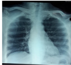
Gambar 4. Foto toraks pasien saat kontrol mengesankan sisa kontras yang sudah berkurang

sisi kiri yang mengesankan sisa kontras (Gambar 2).