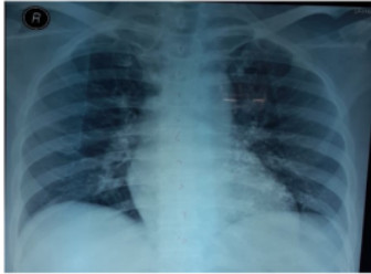
Gambar 2. Foto toraks pasien saat kontrol mengesankan masih terdapat sisa kontras

kimia berupa barium pada saat dilakukan tindakan esofagografi dan mengalami komplikasi pneumonia sekunder yang dalam perjalanan penyakitnya mengalami perbaikan setelah dilakukan tindakan bronkoskopi dan antibiotik yang tepat.