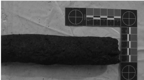
Gambar 2. Salah satu temuan tulang panjang yang diduga terinfeksi sifilis dengan pola penebalan tulang dan granuloma (Sumber: dokumentasi Toetik).

berupa pelengkungan yang tampak dari sisi lateral, dan pemipihan tulang yang teramati dari sisi frontal. Kondisi demikian pada sebagian besar tulang panjang juga ditemukan di karung lain yaitu karung dengan kode GBB XII (gambar 3.). Temuan dengan karakteristik-karakteristik seperti itu mengindikasikan bahwa infeksi sifilis dialami oleh individu-individu tentara Jepang dan juga masyarakat lokal.