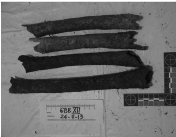
Gambar 3. Beberapa temuan fragmen tulang panjang dengan pola abnormalitas yang diduga disebabkan oleh infeksi sifilis.

Berkaitan dengan pola sebaran infeksi, tampaknya perilaku seksual berperan besar dalam penularannya antar individu. Salah satu kemungkinan penyebab tingginya infeksi sifilis pada sisa-sisa rangka manusia yang ditemukan adalah adanya Jugun lanfu (perempuan penghibur).