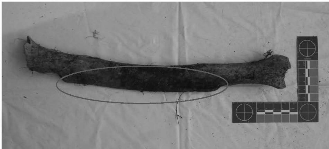
Gambar 1. Fragmen tibia dari karung berkode GBB III. Penebalan tulang sisi anterior (dalam lingkaran) memberikan efek pelengkungan tulang.

Pelengkungan tulang ( bowing ) ditemukan di sebagian besar temuan tulang panjang ( tibia ) sisa rangka dari Gua Binsari. Beberapa tibia yang terindikasi mengalami pelengkungan ada di dalam karung dengan kode Gua Binsari B III (GBB III) (lihat Gambar 1.). Karakteristik pelengkungan yang teramati adalah adanya bentukan tulang pada periosteum sisi anterior dan permukaan bagian medialnya. Karakteristik tersebut mengarahkan pada dugaan bahwa pelengkungan yang terjadi, salah satunya disebabkan oleh infeksi yaws .