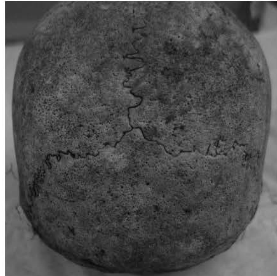
Gambar 4. Pola porotic hyperostosis pada tengkorak (GBB VII) yang tampak di bagian parietal (kiri-kanan) serta occipital (Sumber: dokumentasi Toetik).

tentara Jepang pada PD II. Kondisi PH yang teramati diduga berkaitan dengan kondisi hidupnya selama masa perang yang tidak tercukupi dari segi asupan nutrisi. Di sisi lain, permasalahan infeksi penyakit juga berkorelasi pada timbulnya kondisi nutritional deficiency .