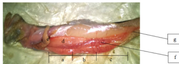
Gambar 1. Posisi gonad pada tubuh ikan pusu; (a) bagian anterior gonad, (b) bagian medial gonad, (c) bagian posterior, (d) warna gonad putih keruh, (e) esofagus, (f) kapiler darah dan (g) anus.

Tahap resting pada gonad ikan pusu pada ikan pusu yang diperoleh dari Perairan Ujung Pangkah dan Weru memiliki ciri-ciri berupa bagian posterior gonad terdapat kapiler darah berwarna keunguan dengan bagian ventral gonad berwarna putih keruh. Hal ini sesuai dengan pernyataan Murua et al. (2003) yang menyatakan bahwa tahap resting pada ikan laut umumnya terlihat gonad berwarna keunguan dan masih terdapat oosit.