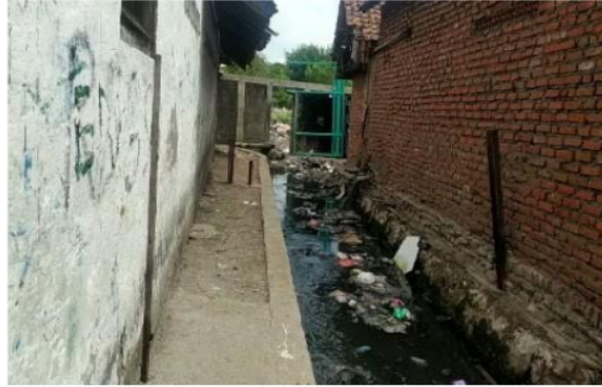
Gambar 3. Kondisi sampah yang terbawa dari aliran sungai di lingkungan RW XI

Setelah proses FGD, dilanjutkan dengan melakukan indepth interview pada stake holder seperti RT/RW. Hal tersebut dilakukan untuk mengetahui kebijakan atau program yang telah dilaksanakan oleh para petinggi dalam mengatasi masalah di lingkungannya. Berdasarkan indepth interview yang dilakukan, mendapatkan hasil bahwa hanya beberapa RT yang melakukan pengangkutan sampah, sehingga hal tersebut menyebabkan masyarakat masih saja membuang sampah sembarangan. Pengangkutan sampah yang dilakukan juga tidak langsung diletakkan pada TPS (Tempat Penampungan Sementara) melainkan pada lahan kosong yang berada di RW XI. Jadwal pengangkutan yang tidak rutin juga membuat masyarakat melakukan alternatif lain dengan cara membuang di sungai maupun lahan kosong.