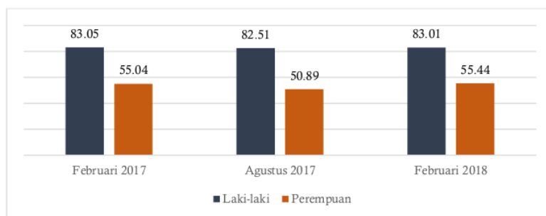
Gambar 1. TPAK Menurut Jenis Kelamin (persen)

Di satu sisi, peran perempuan terus mengalami peningkatan baik di bidang sosial maupun ekonomi pada negara berkembang termasuk Indonesia (Benyamin, 1996). Sebagai salah satu bukti, partisipasi aktif tenaga kerja perempuan terus meningkat dalam beberapa dekade. Data Sakernas menunjukkan bahwa pada tahun 1971 tingkat partisipasi aktif (TPAK) perempuan sebesar 37 persen, kemudian meningkat menjadi 44,6 persen pada tahun 1990 dan kembali meningkat menjadi 55,44 persen pada tahun 2018. Namun demikian, TPAK perempuan masih jauh lebih rendah dibandingkan TPAK laki-laki. Seperti tampak pada gambar 1 TPAK laki-laki tahun 2017-2018 sekitar 1,5 kali lebih tinggi dari TPAK perempuan.