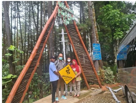
Gambar 5. Penyerahan sumbangan rambu di daerah wisata Hutan Nongko Ijo

Kegiatan kelima adalah pelatihan pencegahan gigitan ular di kawasan wisata. Kegiatan pelatihan ini merupakan hasil kerjasama antara UNAIR dengan Desa Kare untuk membantu staf lokasi wisata Madiun. Pasalnya, banyak risiko gigitan ular di kawasan wisata yang dialami para pekerja dan pengunjung objek wisata.