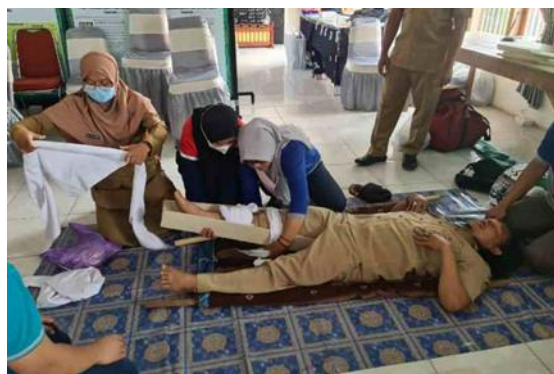
Gambar 1. Pelatihan antisipasi kecelakaan di daerah wisata

Adapun rincian kegiatan pengabdian masyarakat yang dilakukan adalah Pertama kegiatan pengabdian melalui bidang Kesehatan masyarakat dan lingkungan mengusung tema “Pelatihan Antisipasi Kecelakaan di Tempat Kerja untuk penguatan para pelaku wisata di Desa Kare sebagai desa pariwisata” yang terlihat pada Gambar 1. Pariwisata memiliki efek yang sangat beragam dan bisa berimbas pada perkembangan sebuah wilayah. Dalam jangka waktu yang panjang, pariwisata mampu menyediakan lapangan pekerjaan bagi masyarakat sekitar. Kegiatan pariwisata dalam perekonomian daerah merupakan salah satu industri produktif yang dapat memberikan kontribusi signifikan terhadap pendapatan daerah (Nuraina, E. dan Wijaya, A.L., 2014).