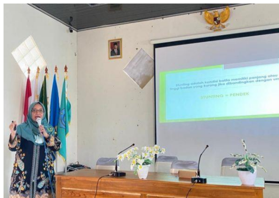
Gambar 7. Edukasi pencegahan stunting

Kegiatan ketujuh dalam rangka peningkatan pengetahuan orang tua (terutama keluarga baru) tentang 1000 hari pertama kelahiran (HPK) sangat penting. Hal ini untuk menjamin pertumbuhan anak agar normal dan tidak mengalami kekurangan gizi serta stunting (pendek). Dalam rangka memberikan pemahaman tersebut pada para orang tua, Universitas Airlangga bekerjasama dengan pemerintah Desa Kare, Kecamatan Kare, Kabupaten Madiun menyelenggarakan Seminar Deteksi Dini Stunting dan Pentingnya 1000 HPK, terlihat pada Gambar 7.