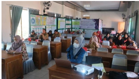
Gambar 2. Pelatihan penyiapan produk UMKM terstandar wisata

Kegiatan kedua, terkait penguatan BUMDES meliputi topik “Peran UMKM sebagai Penguat Branding Destinasi Wisata” dan “Optimalisasi Kemasan dengan Prinsip AIDA”, yang terlihat pada Gambar 2. Penguatan branding pariwisata dapat diberikan melalui produk UMKM sehingga sebuah tempat wisata menjadi populer. Dan juga seminar tentang tips memperkuat kemasan produk dengan prinsip AIDA. AIDA merupakan singkatan yang terdiri dari attention , interest , direction and action . Keempat prinsip ini harus tercermin dalam kemasan produk. Syarat utama dalam pemasaran kemasan adalah harus menarik perhatian, membangkitkan minat, memberikan isyarat (petunjuk) dan memotivasi konsumen untuk bertindak (Puspitarini, Dinda S., Reni N.. 2019).