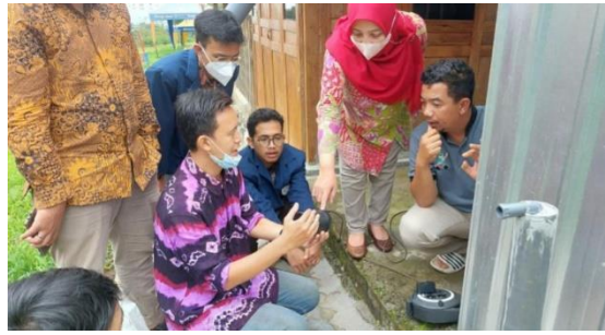
Gambar 4. Instalasi kran air otomatis untuk penghematan air

pelatihan dan cara instalasi kran otomatis yang dihadiri oleh kader wisata dan pokdarwis (kelompok sadar wisata) Kare, terlihat pada Gambar 4.