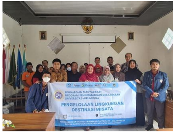
Gambar 6. Seminar pengelolaan lingkungan destinasi wisata

Kegiatan ketujuh dalam rangka peningkatan pengetahuan orang tua (terutama keluarga baru) tentang 1000 hari pertama kelahiran (HPK) sangat penting. Hal ini untuk menjamin pertumbuhan anak agar normal dan tidak mengalami kekurangan gizi serta stunting (pendek). Dalam rangka memberikan pemahaman tersebut pada para orang tua, Universitas Airlangga bekerjasama dengan pemerintah Desa Kare, Kecamatan Kare, Kabupaten Madiun menyelenggarakan Seminar Deteksi Dini Stunting dan Pentingnya 1000 HPK, terlihat pada Gambar 7.