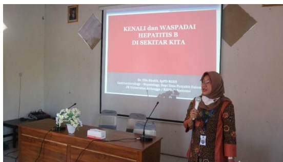
Gambar 3. Seminar strategi tangguh terhadap penyakit menular

Kegiatan ketiga, tenaga kesehatan Desa Kare Kecamatan Kare Kabupaten Madiun mengikuti serangkaian pelatihan. Pelatihan dengan topik ‘Kenali dan Waspadai Hepatitis B di Sekitar Kita’ yang diikuti oleh lebih dari 20 orang tenaga kesehatan, staf Desa Kare, serta ibu-ibu pemilik usaha khas desa Kare, yang terlihat pada Gambar 3. Sebagai desa pariwisata pelatihan ini diperlukan karena destinasi atau sasaran warga yang cukup banyak. Selain itu, Universitas Airlangga sebagai kampus life sciences concern terhadap kesehatan masyarakat, khususnya terkait hepatitis B.