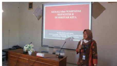
Gambar 3. Seminar strategi tangguh terhadap penyakit menular

Kegiatan ketiga, tenaga kesehatan Desa Kare Kecamatan Kare Kabupaten Madiun mengikuti serangkaian pelatihan. Pelatihan dengan topik ‘Kenali dan Waspada Hepatitis B di Sekitar Kita’ yang diikuti oleh lebih dari 20 orang tenaga kesehatan, staf Desa Kare, serta ibu-ibu pemilik usaha khas desa Kare, yang terlihat pada Gambar 3. Sebagai desa pariwisata pelatihan ini diperlukan karena destinasi atau sasaran warga yang cukup banyak. Selain itu, Universitas Airlangga sebagai kampus life sciences concern terhadap kesehatan masyarakat, khususnya terkait hepatitis B.