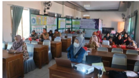
Gambar 2. Pelatihan penyiapan produk UMKM terstandar wisata

Kegiatan kedua, terkait penguatan BUMDES meliputi topik “Peran UMKM sebagai Penguat Branding Destinasi Wisata” dan “Optimalisasi Kemasan dengan Prinsip AIDA”, yang terlihat pada Gambar 2. Penguatan branding pariwisata dapat diberikan melalui produk UMKM sehingga sebuah tempat wisata menjadi populer. Dan juga seminar tentang tips memperkuat kemasan produk dengan prinsip AIDA. AIDA merupakan singkatan yang terdiri dari attention, interest, direction and action . Keempat prinsip ini harus tercermin dalam kemasan produk. Syarat utama dalam pemasaran kemasan adalah harus menarik perhatian, membangkitkan minat, memberikan isyarat (petunjuk) dan memotivasi konsumen untuk bertindak (Puspitarini, Dinda S., Reni N.. 2019).