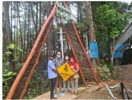
Gambar 5. Penyerahan sumbangan rambu di daerah wisata Hutan Nongko Ijo

Kegiatan kelima adalah pelatihan pencegahan gigitan ular di kawasan wisata. Kegiatan pelatihan ini merupakan hasil kerjasama antara UNAIR dengan Desa Kare untuk membantu staf lokasi wisata Madiun. Pasalnya, banyak risiko gigitan ular di kawasan wisata yang dialami para pekerja dan pengunjung objek wisata.