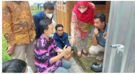
Gambar 4. Instalasi kran air otomatis untuk penghematan air

pelatihan dan cara instalasi kran otomatis yang dihadiri oleh kader wisata dan pokdarwis (kelompok sadar wisata) Kare, terlihat pada Gambar 4.