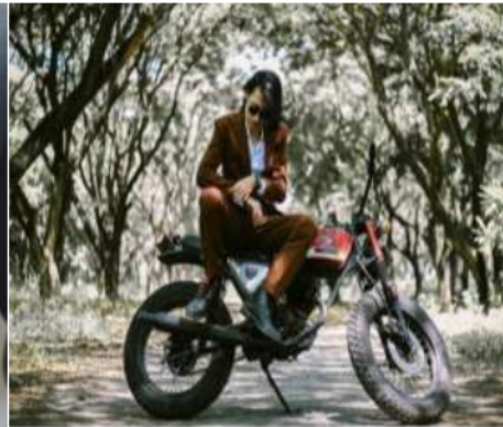
Figur 2: Style Description

Jadikan weekendmu spesial dengan Authentic Package Sounds Husky. Setelan jas berbahan wool yang tebal namun lentur dan nyaman dipakai, serta tekstur kain yang berberat memiliki kesan tampilan pola garis halus unik yang akan membuatmu tampil berbeda dalam pesta atau special moment kamu!