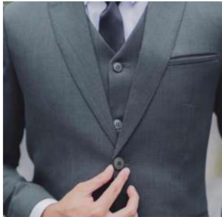
Figur 1: Haptic Description