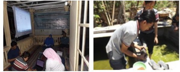
Gambar 4. Kegiatan penyampaian materi dan praktek langsung TIS

Hasil kegiatan pelatihan TIS pada anggota kelompok mitra menunjukkan perkembangan pengetahuan dan keterampilan anggota kelompok mitra semakin baik. Hal ini terlihat pada saat diskusi dan pelatihan yang dipraktikkan secara langsung oleh anggota kelompok mitra (Gambar 4).