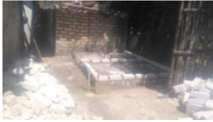
Gambar 2. Penentuan lokasi atau lahan untuk pembuatan bak tembok atau sarana pemeliharaan dan pemijahan induk ikan lele di kelompok mitra

juga dilakukan untuk memperlancar pelaksanaan kegiatan, sebagaimana Gambar 3.