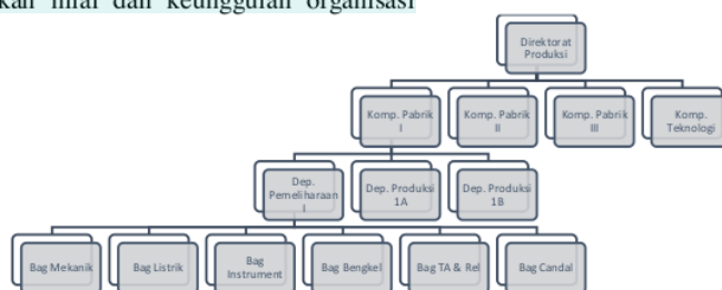
Gambar 1. Struktur Organisasi Departemen Pemeliharaan I

Departemen Pemeliharaan I PT Petrokimia Gresik secara struktural berada di bawah Kompartemen Pabrik I. Tugas Departemen Pemeliharaan I adalah menjaga reliability equipment Pabrik I untuk mendukung target produksi Departemen Produksi I.