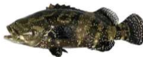
Gambar 1. Ikan kerapu cantang (Rizkya, 2012)

Ikan kerapu hibrida cantang memiliki bentuk tubuh compress dan relatif membulat dengan ukuran lebar kepala sedikit atau hampir sama dengan lebar badannya, kulit berwarna coklat kehitaman dengan lima garis hitam melintang di bagian tubuhnya, semua sirip bercorak seperti ikan kerapu kertang dengan dasar berwarna kuning yang dilengkapi bintik-bintik hitam yang juga banyak tersebar di kepala dan di dekat sirip pectoral dengan jumlah yang berbeda pada setiap individu, sirip punggung melebar ke arah belakang, menyatu dan terdiri atas 11 jari-jari keras dan 15 jari-jari lunak, sirip pectoral terdiri atas 17 jari-jari lunak, sirip ventral terdiri dari 1 jari-jari keras dan 5 jari-jari lunak, sirip anal terdiri dari 2 jari-jari keras dan 8 jari-jari lunak, sedangkan sirip caudal terdiri atas 13 jari-jari lunak, bentuk ekor rounded , bentuk mulut lebar superior (bibir bawah lebih panjang dari bibir atas), tipe sisik ctenoid (bergerigi), dan bentuk gigi runcing ( canine ). Ikan kerapu hibrida cantang memiliki ciri khas yang membedakan dengan induknya yaitu warna kulit coklat kehitaman dengan lima garis hitam dan memiliki bintik hitam yang tersebar di bagian kepala dan dekat sirip pectoral (Rizkya, 2012), sebagaimana terlihat pada Gambar 1.