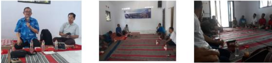
Gambar 2. Penyuluhan dan diskusi bersama Pokdakan Rasbora 15 dan Mina Jam 3 bertempat di Mushola tempat Pokdakan Rasbora 15