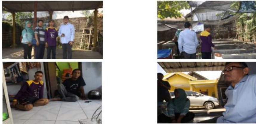
Gambar 1. Diskusi persiapan pelaksanaan pelatihan dan peninjauan lokasi budidaya ikan kelompok mitra PKM bersama Ketua Pokdakan Rasbora 15 dan pendamping dari UPT Pengembangan Budidaya Air Tawar Umbulan, Pasuruan