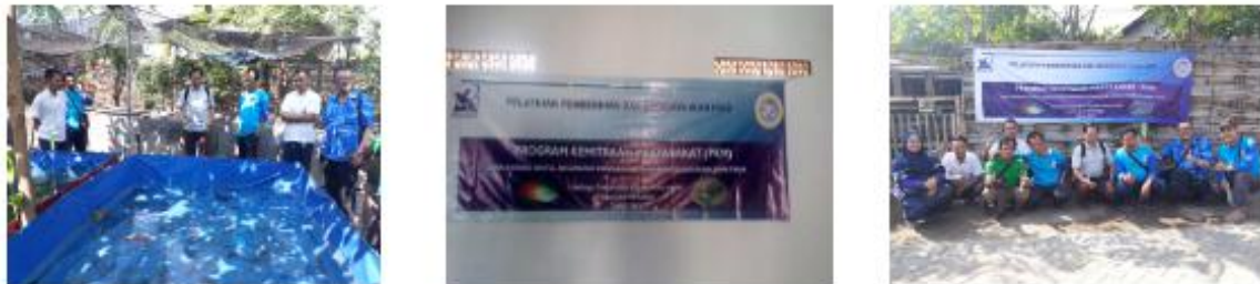
Gambar 3. Praktek lapang pada pelatihan pembenihan dan budidaya ikan hias