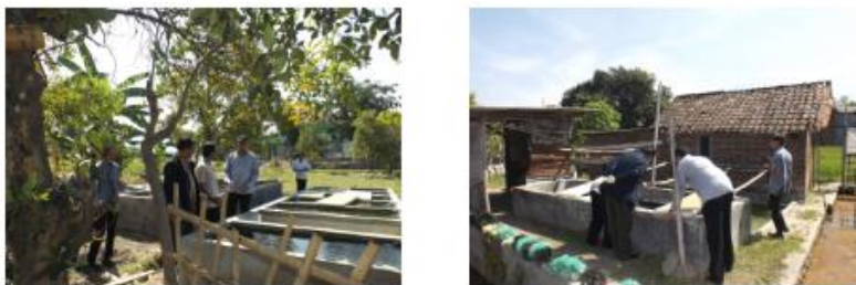
Gambar 4. Kegiatan monitoring dan evaluasi PKM pada kelompok mitra