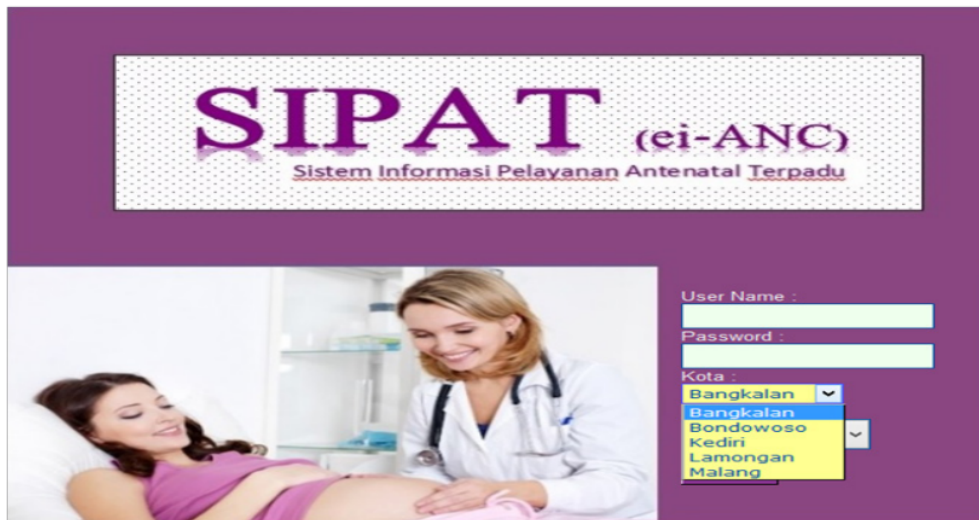
Gambar 1. Menu Login

PHP 5 dan JavaScript dan database Firebird . Aplikasi ini dirancang berbasis web dengan memanfaatkan Apache web server sebagai pendukungnya. Teknologi yang dibutuhkan untuk mengoperasikan SIPAT, yaitu Hardware dan Software: 1) Laptop/PC: Intel Pentium IV; OS: Multiplatform (misalnya Windows, Linux, Android); Memory 1 MB; Resolusi Monitor 1024 x 768; Browser Mozilla, 2) Tablet: OS Android Jelly Bean; Layar 7"; Brow-ser Mozilla.