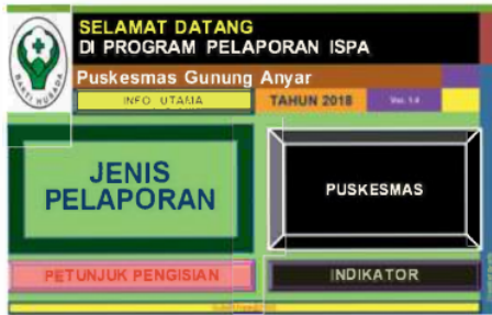
Gambar 1. Tampilan Menu Depan Software Program Pelaporan ISPA