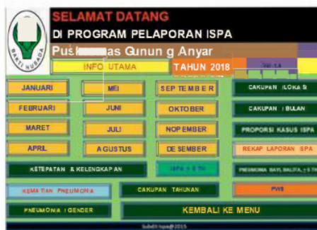
Gambar 2. Tampilan Menu Program Pelaporan ISPA

Proporsi Kasus ISPA, Rekap Laporan ISPA, Pneumonia Bayi, Balita, \geq 5 th, PWS, Kematian Pneumonia, Pneumonia/Gender, Cakupan Tahunan, ISPA \geq 5 th. Semua menu tersebut menampilkan grafik dari hasil data yang telah diinput pada tiap bulannya.