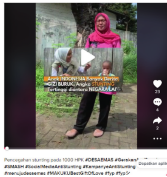
Gambar 6. Video kampanye anti stunting di desa Rambipuji

Gambar 3-6 menunjukkan video kampanye anti stunting yang dibuat oleh masyarakat Bersama tim PAR sebagai tindakan dalam menangani masalah stunting yang terjadi di wilayah tersebut. Dari berbagai video kampanye yang telah dibuat menunjukkan berbagai konsep yang dilakukan pada video tersebut Dampak dari kegiatan kaji tindak ini adalah terwujudnya kemandirian masyarakat dalam memecahkan masalah yang ada di sekitarnya.