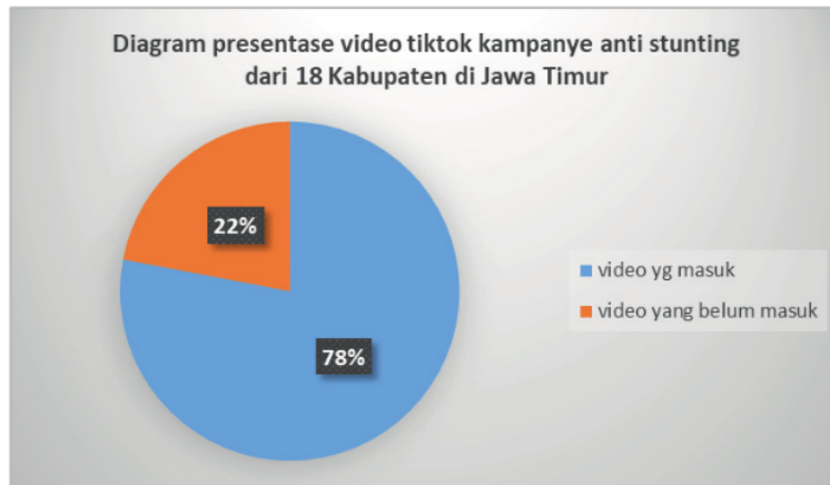
Gambar 2. Diagram presentase video tiktok yang masuk pertanggal 8 November 2022

Berdasarkan gambar 2 menunjukkan bahwa pertanggal 8 November 2022 presentase video tiktok yang masuk sebesar 78 % dari 360 video yang diharapkan masuk. Ini menjadi indikator keberhasilan dari metode PAR dalam melakukan pemberdayaan masyarakat. Hal ini sejalan dengan konsep dari metode Participatory Action research , dimana PAR berbicara mengenai berhasil atau tidak berhasil.