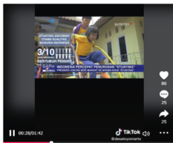
Yuk Cegah Stunting Pada Baduta Dengan ASIK #DESAEMAS #GerakanAntiStunting #SMASH #SocialMediaAntiStunting #KampanyeAntiStunting #MenujuDesaEmas