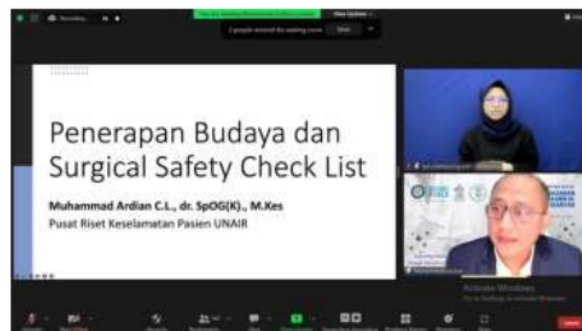
Gambar 1. Pemberian Materi dan Studi Kasus oleh Pemateri Pertama Terkait Penerapan Budaya dan Surgical Safety List

Pelatihan dilakukan satu kali melalui pemberian materi dan studi kasus pada tiga topik. Topik yang diberikan adalah surgical safety checklist dan budaya keselamatan pasien, komunikasi efektif bagi tenaga kesehatan, dan pencegahan pasien jatuh. Pengetahuan peserta diukur dua kali yaitu sebelum materi ( pretest ) dan sesudah materi diberikan ( posttest ). Jenis penelitian ini merupakan penelitian cross sectional yang memakai rancangan pretest-posttest design . Penelitian dilakukan pada Bulan Agustus 2022 berlokasi di Rumah Sakit Umum Daerah Sanjiwani Gianyar Bali. Populasi dalam penelitian ini adalah tenaga kesehatan, tenaga medis, dan tenaga non kesehatan pendukung yang ada di rumah sakit tersebut. Teknik sampling yang digunakan adalah purposive sampling . Sampel yang diambil dari populasi merupakan tenaga yang didelegasikan oleh rumah sakit untuk mengikuti pelatihan.