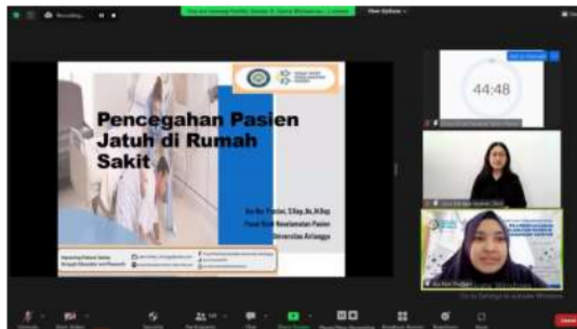
7 Gambar 3. Pemberian Materi dan Studi Kasus oleh Pemateri Ketiga Terkait Pencegahan Pasien Jatuh di Rumah Sakit

Pengukuran dilakukan dengan pengisian kuesioner yang bertujuan untuk menguji pengetahuan peserta terkait tiga topik sasaran keselamatan pasien tersebut. Dilakukan uji statistik untuk mengetahui peningkatan skor pengetahuan dari pretest dan posttest dengan uji Wilcoxon Rank. Hasil p < 0,05 dengan CI 95% akan menunjukkan hasil yang bermakna secara statistik (Dahlan 2010). Pengujian statistik dilakukan dengan bantuan perangkat lunak komputer Jamovi versi 2.2.5.