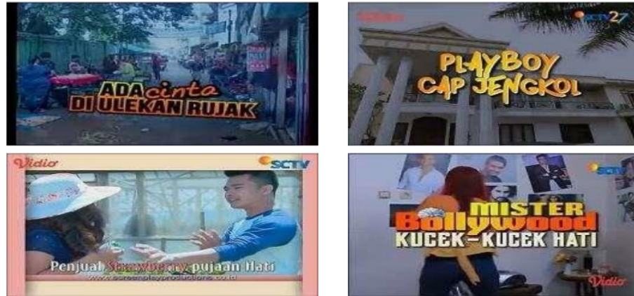
Gambar 1. Tampilan Penulisan Judul FTv

didambakan (diharapkan). Arti kedua adalah aspirasi atau keinginan. Kamus Besar Bahasa Indonesia memberikan contoh dengan kata "pria idaman" yang artinya; pria ideal yang diidamkan wanita (paling dicari). Kata "cinta" dan "hati" menjadi penanda yang jelas bagi kelompok sasaran pemirsa FTv, yakni remaja.