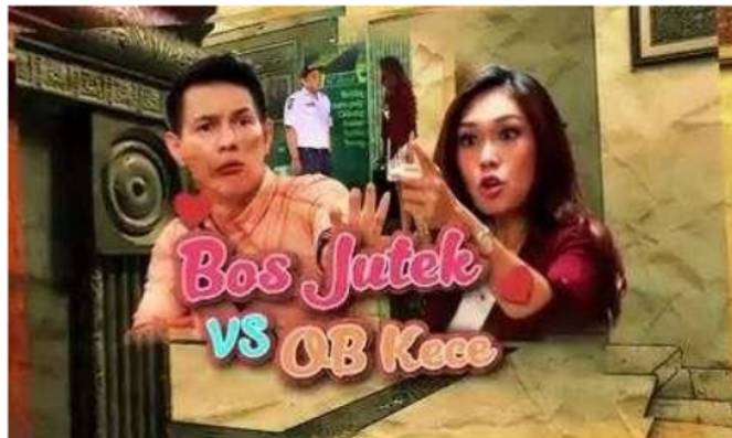
Gambar 4. Layar FTV "Bos Jutek VS OB Kece"

memerintahkan sekretarisnya untuk mencari OB baru untuk perusahaan. Pekerjaan OB baru diisi oleh seorang pria bernama Udin.