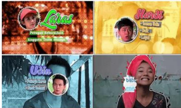
Gambar 2. Tipe A - Profil Orang Biasa/Miskin/Rendah

gambar. Ini membantu penulis naskah dan sutradara membuat adegan yang menunjukkan karakter. Penonton cukup membaca informasi atau identitas karakter di awal. Hal ini berbeda dengan sinetron dan film, membuat penonton mengkategorikan karakter tersebut. MD Entertainment melakukan metode ini.