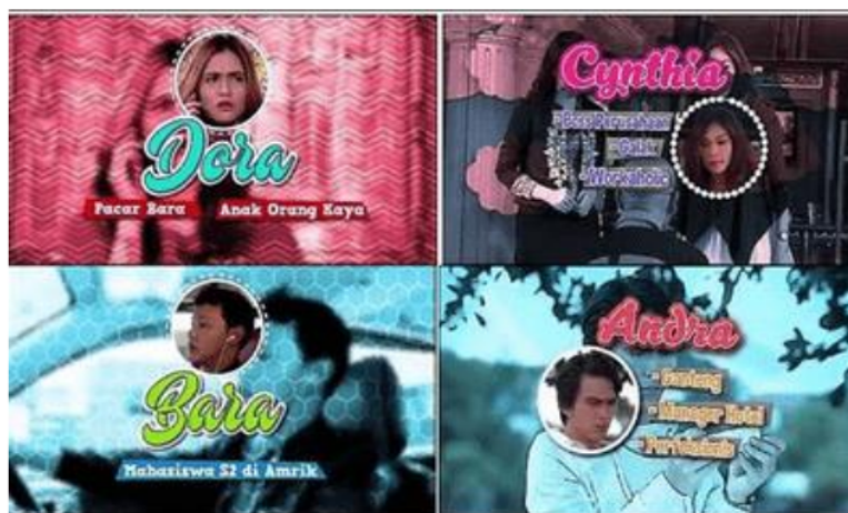
Gambar 3. Tipe B - Profil Orang Kaya/Eksekutif/Tinggi

Jika memperhatikan Gambar 2 dan Gambar 3 , pemirsa FTV akan langsung mengetahui siapa yang kaya dan siapa yang juga berperan sebagai orang miskin. Pertama, orang kaya akan diberi nama yang khas. Beberapa menunjuk ke nama-nama yang bukan asli Indonesia atau lebih seperti nama barat, seperti Cynthia. Atau, namanya sering langsung merujuk pada kekayaannya, seperti Sultan dan Pangeran. Tentu saja, nama seperti itu tidak pernah ada dalam kehidupan sehari-hari. Sedangkan nama orang miskin atau orang yang kurang beruntung biasanya merujuk pada keunikan nama lokal, bahkan dengan syarat objektif tertentu, seperti Udin yang merujuk pada nama orang dewasa dari desa/kampung.