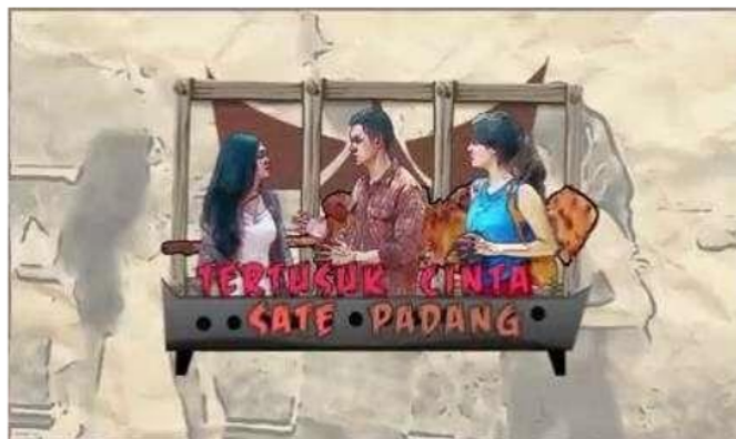
Figure 5. Layar FTV "Tertusuk Cinta Sate Padang"

Migrasi ke Jakarta adalah hal yang sering dilakukan banyak orang, termasuk Ryan. Ryan adalah seorang pemuda dari Padang yang memiliki keinginan besar untuk sukses di Jakarta, Ryan ingin sukses dengan menjual Sate Padang, dan disinilah semua masalah mulai terjadi. Ryan mendapat tentangan dari kekasihnya di Jakarta bernama, Dian. Selain pacarnya, Ryan juga mendapat tentangan dari ibunya, Mak Rose.