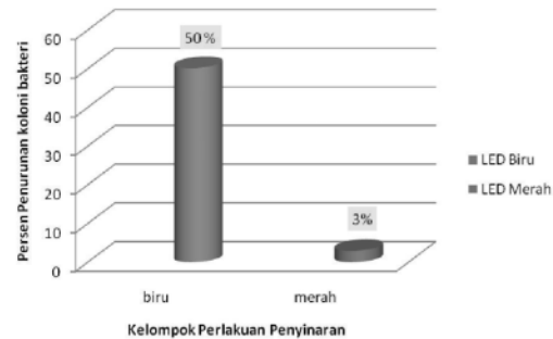
Gambar 2. Diagram persentase penurunan jumlah koloni bakteri Vibrio cholerae yang tumbuh pada peninaran LED biru ( 430 \pm 4 ) nm dan merah ( 629 \pm 6 ) nm