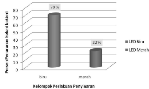
Gambar 1. Diagram persentase penurunan jumlah koloni bakteri Staphylococcus aureus yang tumbuh pada peninaran LED biru ( 430 \pm 4 ) nm dan merah ( 629 \pm 6 ) nm

merah ( 629 \pm 6 ) nm dengan daya PWM 75% dan waktu peninaran 30 menit ditunjukkan pada Gambar 1 dan 2.